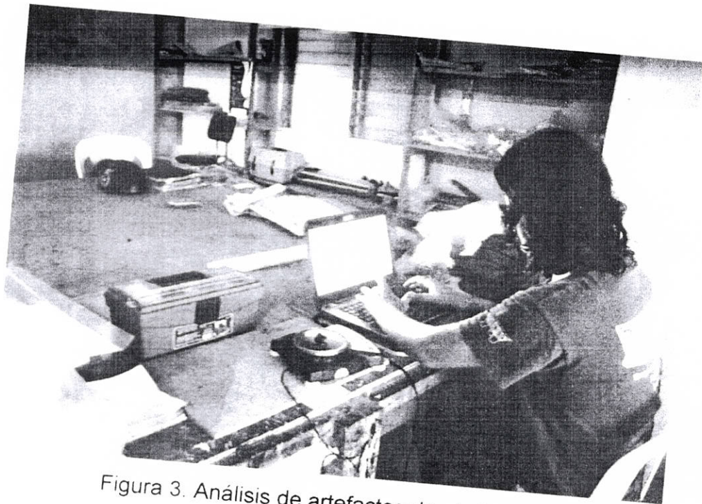
Figura 3. Análisis de artefactos de obsidiana.